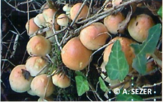
Kök bölgesinde oluşan şapkali mantarları

Kök çürüklüğü etmenlerinden Armillaria mellea şapkali bir mantar olup, şapkalarını sonbaharın ilk yağışlarından sonra oluşturur. Hasta ağaçların kök boğazında oluşan sarımsı kahverengi olan ve dibe doğru siyahlaşan şapkalar 5–15 cm çapındadır. Mantar hem toprakta hem de odun dokusunda yaşar. Ölü ağaçlarda ve toprakta kalan kök parçalarında uzun süre canlılığını devam ettirir. Rutubetli yerlerde iyi gelişme imkânı bulur.